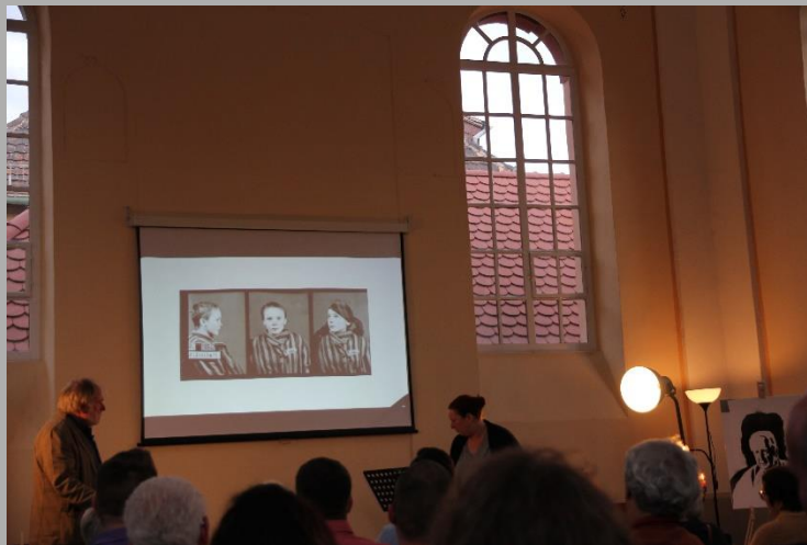
Ein Foto von Wilhelm Brasse aus dem KZ Auschwitz