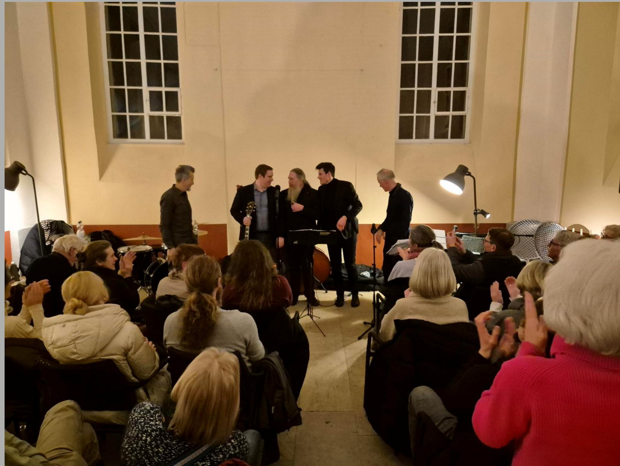
Absprache - Was spielen wir als nächstes?