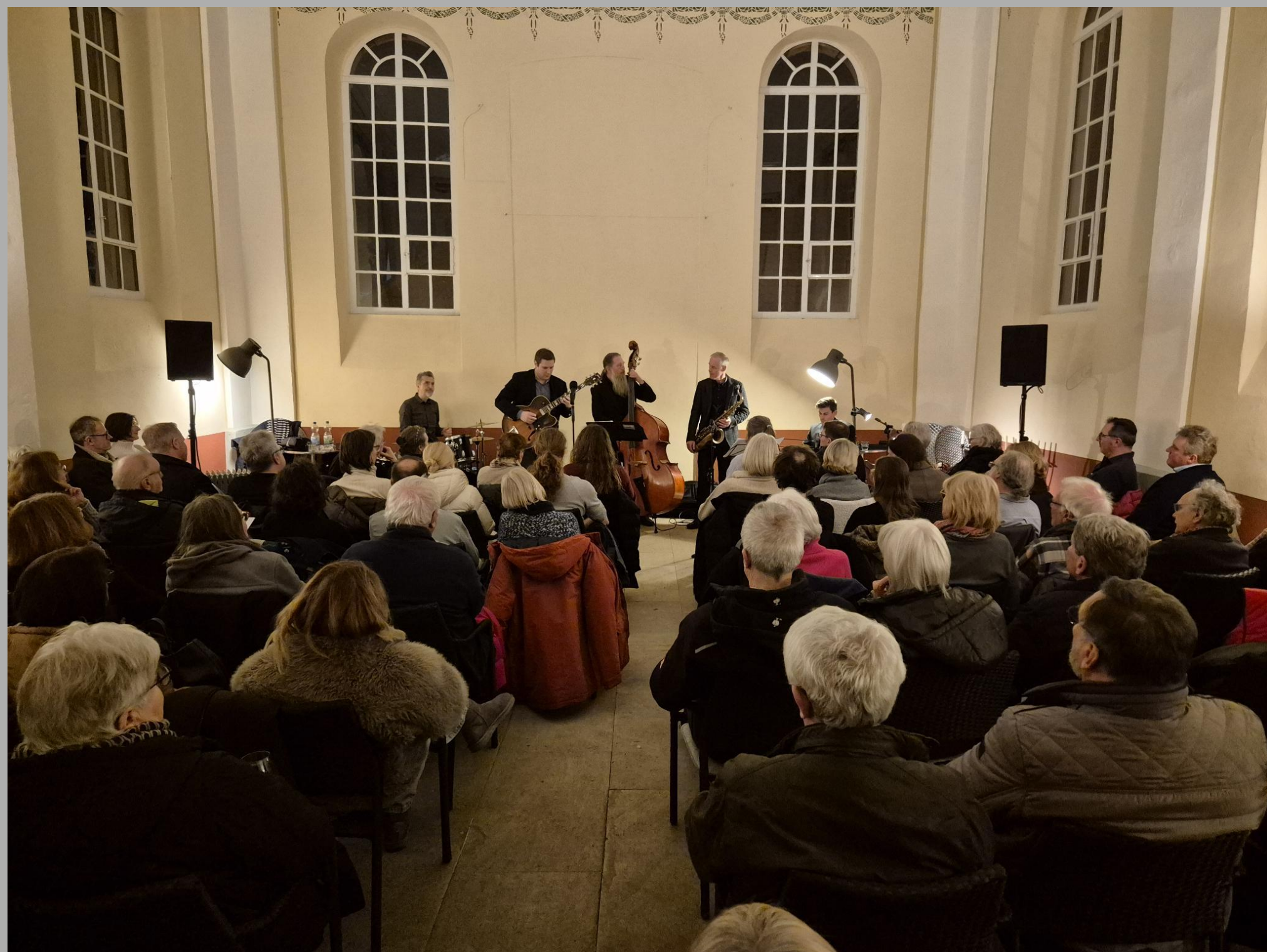
Die vollbesetzt Synagoge