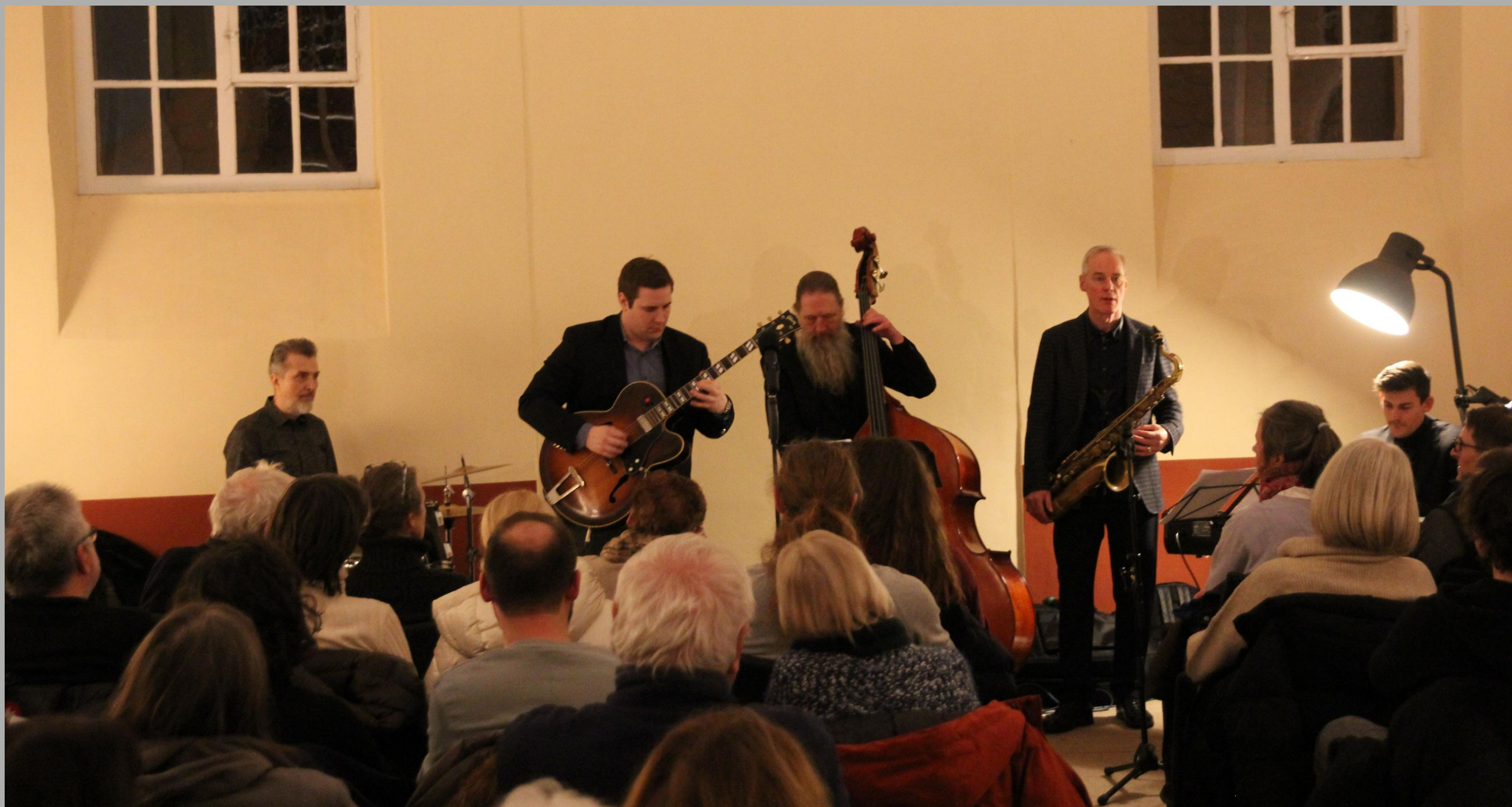
Das Kranich Kollektiv