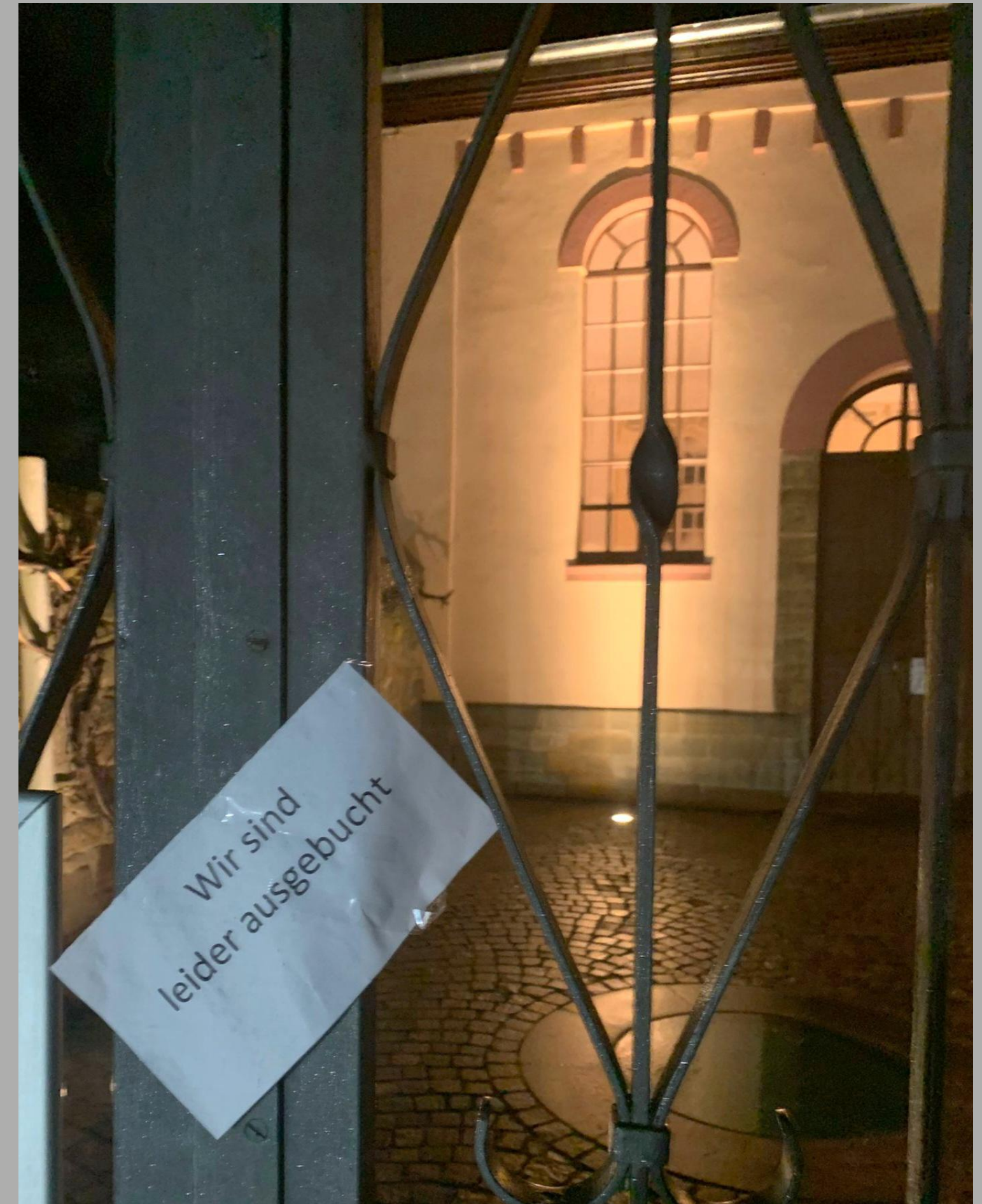
Der Freundeskreis freut sich über die vollbesetzte Synagoge