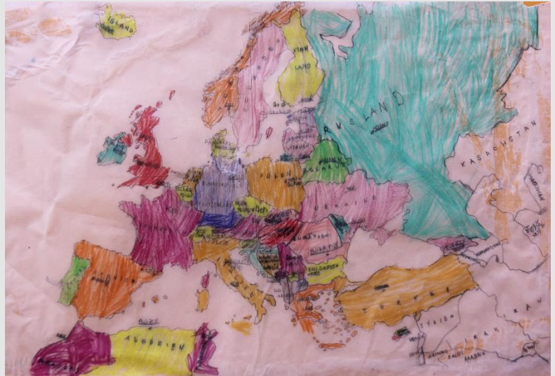
Lounis Jonathan Kochs Blick auf Europa (8 Jahre)

Ehemalige Deidesheimer Synagoge, Bahnhofstraße 19 Oswald-Hugo-Feis-Platz